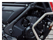
Defensa sobre marco Reforzado