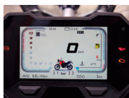
Pantalla TFT Color