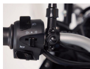
Sistema ABS desconectable